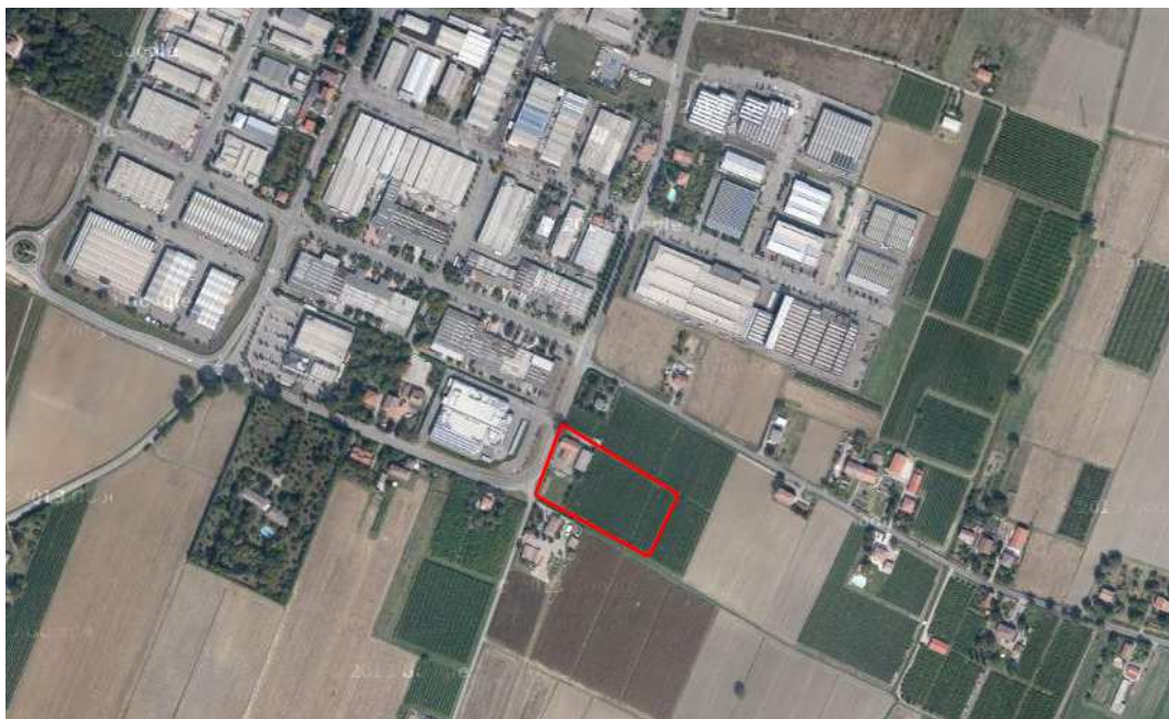
Localizzazione dell'area oggetto di Variante su ortofoto digitale