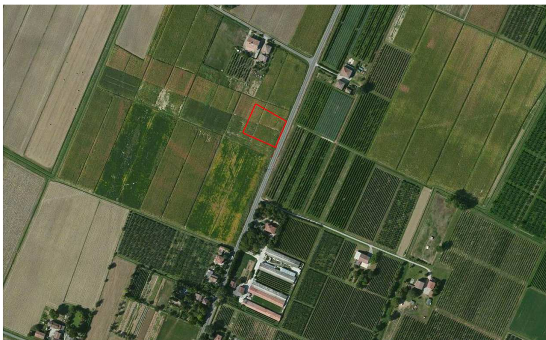
Localizzazione dell'area oggetto di Variante su ortofoto digitale

L'area per il distributore non interessa 'Aree archeologiche' da PSC, in recepimento del PTCP come 'Aree di accertata e rilevante consistenza archeologica b1' (art. 41 A, c. 2, lettera b1 delle Norme del PTCP).