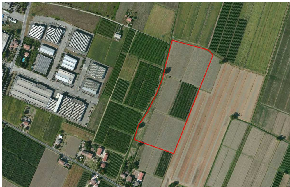
Localizzazione dell'area oggetto di Variante su ortofoto aerea

fondi in oggetto. L'ambito è inserito nel POC vigente per il 60% (l'area oggetto di modifica è pari a ca. il 49% della superficie complessiva dell'ambito), anche se non ancora convenzionato. La modifica comporta pertanto una riduzione del dimensionamento produttivo del piano, come indicato nel par. 5.2. Si provvede inoltre all'aggiornamento della scheda di VALSAT.