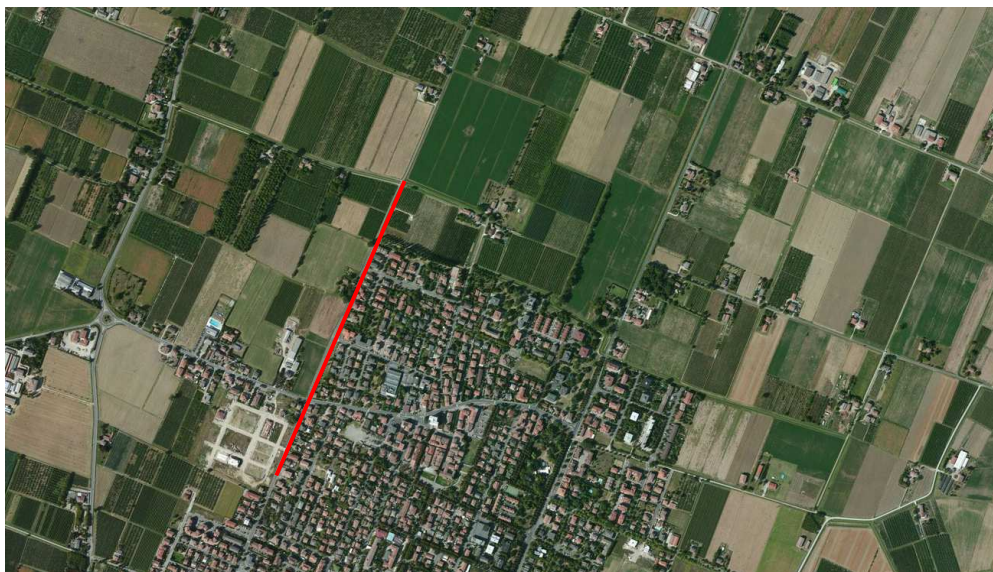
Localizzazione dell'area oggetto di Variante su ortofoto digitale