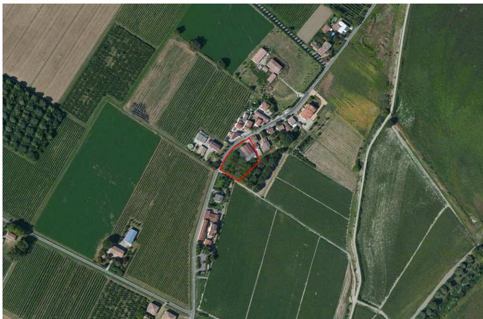
Localizzazione dell'area oggetto di Variante su ortofoto digitale

La riqualificazione dell'area deve inoltre prevedere un miglioramento della accessibilità in condizioni di sicurezza stradale e un nuovo percorso pedonale sul fronte di via Serrasina.