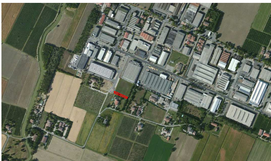
Localizzazione dell'area oggetto di Variante su ortofoto digitale

La variante recepisce nel POC la Del. di G.C. n° 36 del 26/04/2013. Essa comporta la riclassificazione di un'area di superficie pari a 492 mq da Zona omogenea D.3.1 'Porzioni edificabili per attività produttive' a 'Strade nuove e da riqualificare'. La modifica è funzionale a garantire l'accesso alle proprietà poste in ambito agricolo a sud-est del comparto n° 9 e si configura come limitata rettifica dell'ambito produttivo. La variante genera la riduzione della superficie territoriale del comparto 9 per un totale di 492 mq, e limita la Sc massima ammissibile a 2.920 mq, con una riduzione complessiva di 256 mq., determinando una riduzione del dimensionamento di piano (cfr. par. 5.2).