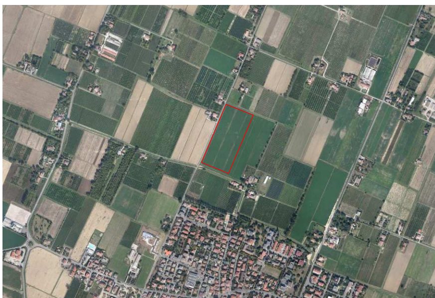
Localizzazione dell'area oggetto di Variante su ortofoto digitale

Si richiama poi la necessità di una progettazione che consenta di limitare la presenza di insetti e animali dannosi e che stabilisca i criteri per la manutenzione ordinaria e straordinaria dell'opera idraulica. Dovrà altresì essere prevista e attuata un'attenta gestione della vasca di laminazione, sempre al fine di evitare possibili problematiche di carattere igienico-sanitario e ambientale.