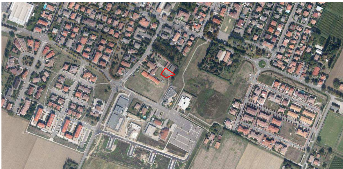
Localizzazione dell'area oggetto di Variante su ortofoto digitale

Il progetto dell'ampliamento è stato sviluppato tenendo conto degli edifici posti nelle immediate vicinanze del cimitero, ed in particolare della Chiesa, della canonica, e della scuola materna parrocchiale, posta a sud-est.