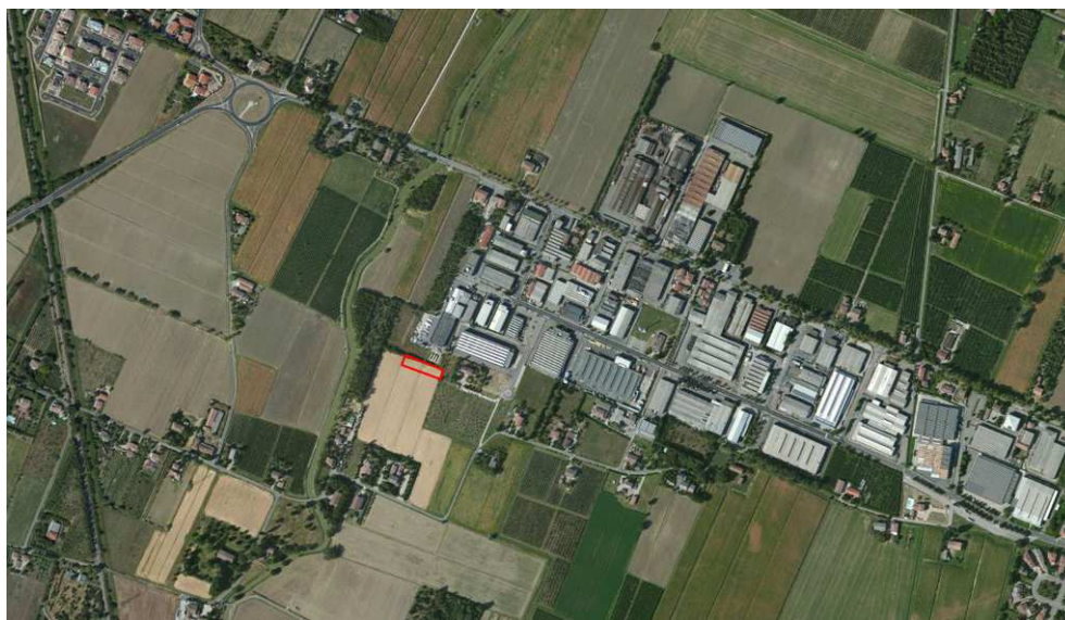
Localizzazione dell'area oggetto di Variante su ortofoto aerea

A causa della forma, della limitata estensione e risultando di altra proprietà rispetto ai lotti produttivi limitrofi, l'area non presenta caratteri di edificabilità indipendente: fra l'altro il terreno è privo di qualsiasi servizio di urbanizzazione primaria e di accesso viario e si configura come frangia urbana. Questo determina anche per i proprietari l'impossibilità di valorizzare la potenzialità edificatoria dell'area, a fronte di oneri certi (IMU).