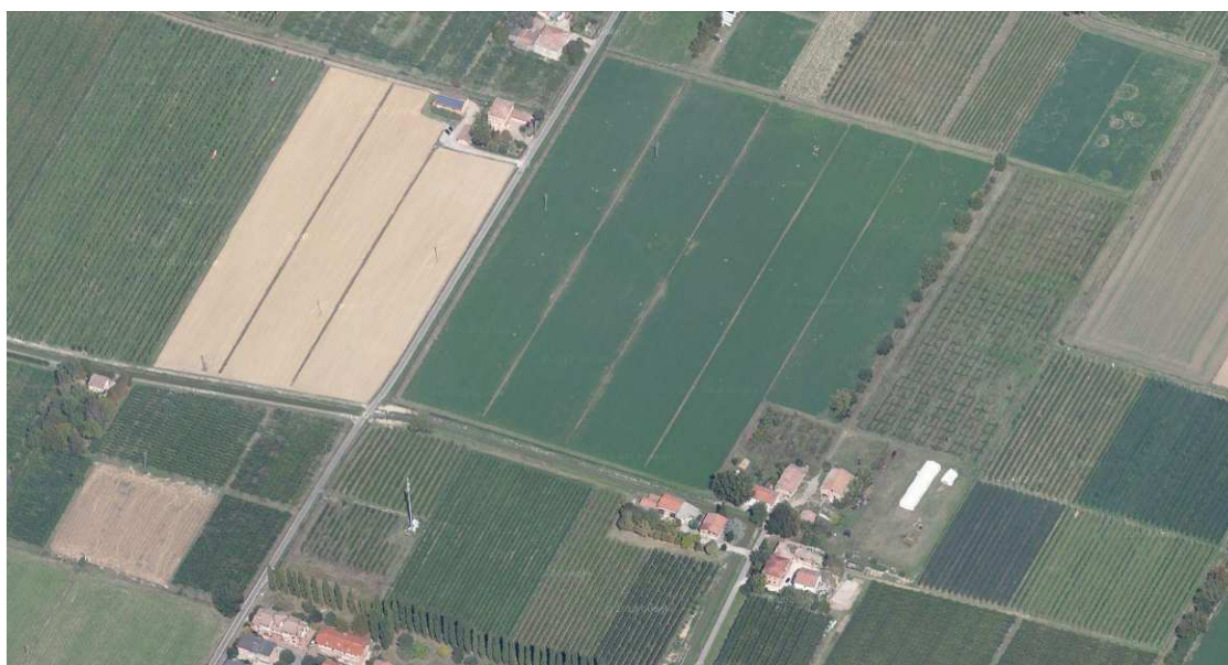
Localizzazione dell'area oggetto di Variante su vista aerea