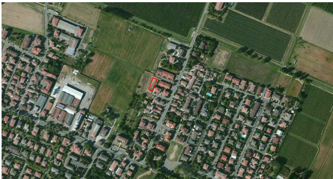
Localizzazione dell'area oggetto di Variante su ortofoto digitale

esistenti. L'area è già 'compromessa' dall'edificazione residenziale e la modifica consentirà la miglior definizione di un margine netto del territorio urbano.