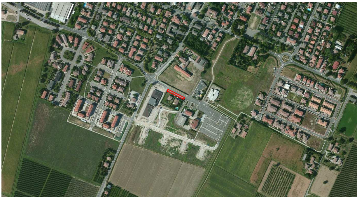
Localizzazione dell'area oggetto di Variante su ortofoto digitale

Le aree sono attualmente in parte asfaltate e in parte occupate da terreno incolto, in entrambe i casi sono delimitate da cordolatura.