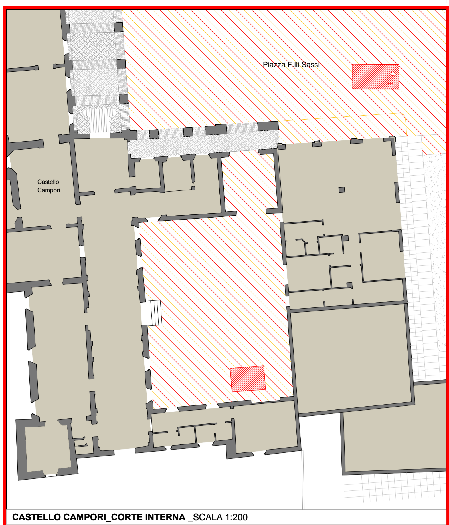
CASTELLO CAMPORI_CORTE INTERNA _SCALA 1:200